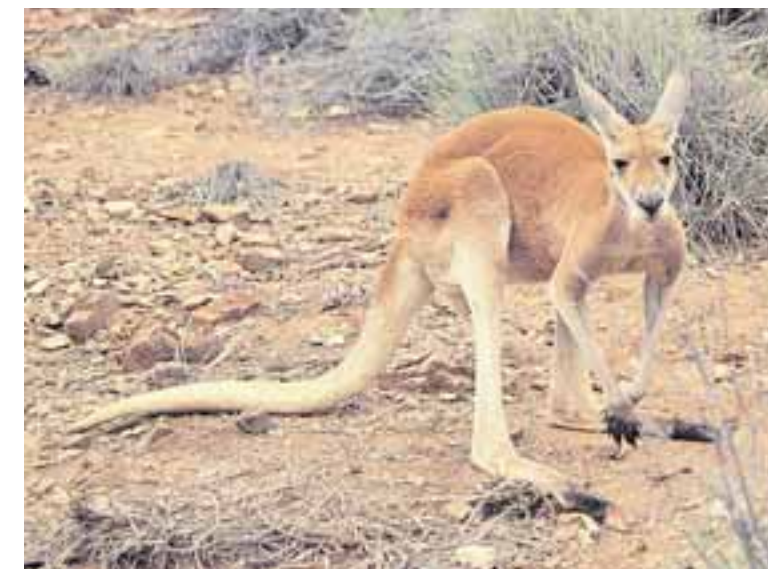
Typischer Bewohner des Northern Territory: das Rote Riesenkänguru.