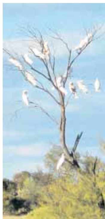
Ein Schwarm weißer Kakadus.