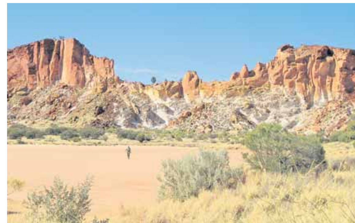
Die Felsen des Rainbow Valley sind eine heilige Stätte der Ureinwohner.