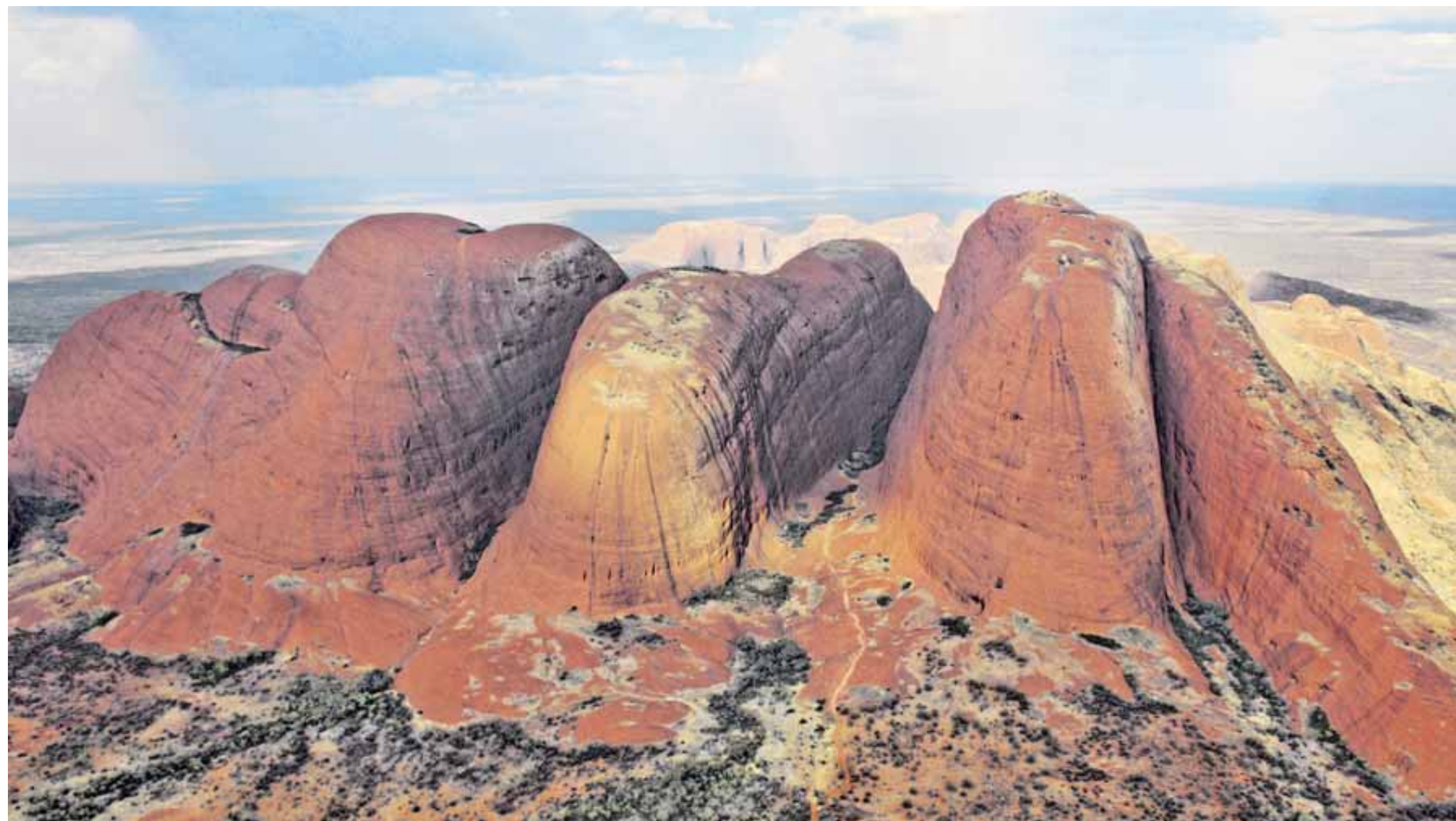
Die imposanten Kata Tjutas, auch Olgas genannt. Die insgesamt 36 Kuppeln gehören zusammen mit dem 30 Kilometer entfernten Uluru zum Unesco-Weltnatur- und Weltkulturerbe.