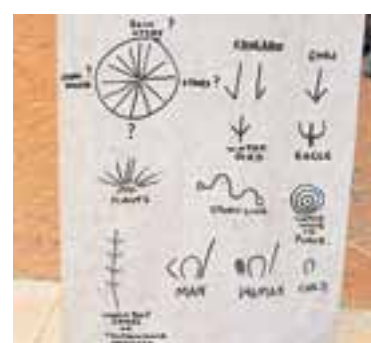
Symbole aus Felsenmalereien.